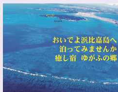
おいでよ浜比嘉島へ泊ってみませんか 癒し宿 ゆがふの郷

40 民宿ゆがふの郷 ☎ 499 520 130*13 うるま市の文化遺産シルミチュの近くに位置する宿泊施設。浜比嘉島の自然の豊かさを満喫でき、目の前は大自然の海を感じられ、ゆったりのんびりとした贅沢な時間を過ごせます。