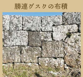
保全のため城壁には登らないようお願いいたします

沖縄のグスクの石積みは、大きく分けて三種類の積み方があります。自然石をだまかに加工して積んだ「野面積(のづらづみ)」、四角い切石を水平に積み上げた「布積(ぬのづみ)」、多角形の石を亀甲型に積んだ「相方積(あいかたづみ)」があり、野面積→布積→相方積と発達したと考えられています。勝連グスクの石積みは、そのほとんどが布積で積みまれています。また、鈎(かぎ)状に組むことで、強度を増した工夫も見られます。